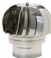
Pás Rebitadas Plus – 100% Inox